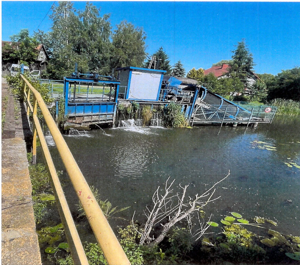
Elektrownia wodna w miejscowości Kroców Mniejszy