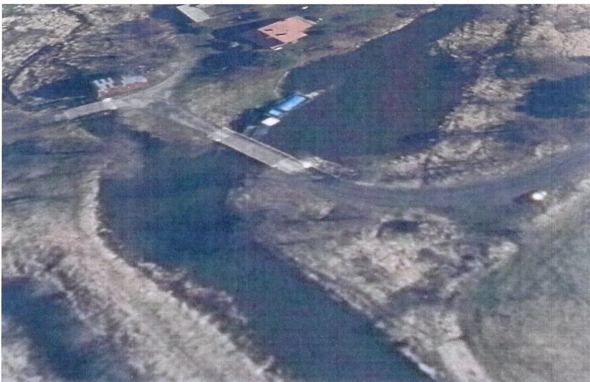
Most i elektrownia wodna na rzece Ilzance w msc. Kroczyce Mniejszym