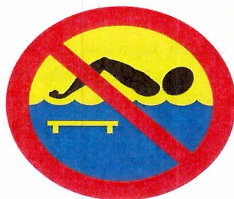
znak – kąpiel zabroniona – most