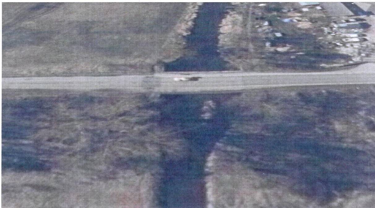
Most na rzece Ilzanka w miejscowości Kazanów