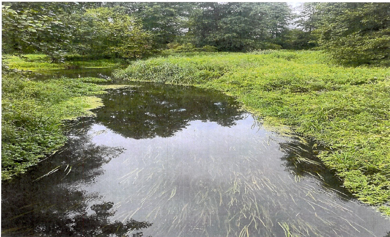
Iżanka w msc. Kroczów.