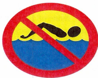
znak – zakaz kąpieli